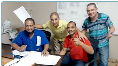
CALHA FORTE Bombeirinho