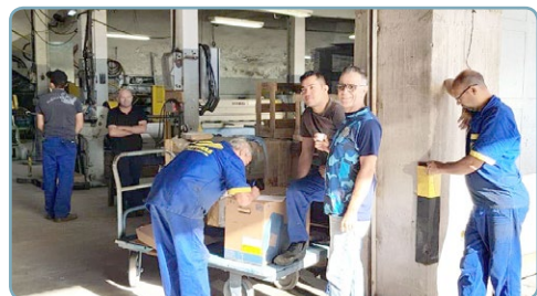
VENTIBRÁS Mixirica e equipe