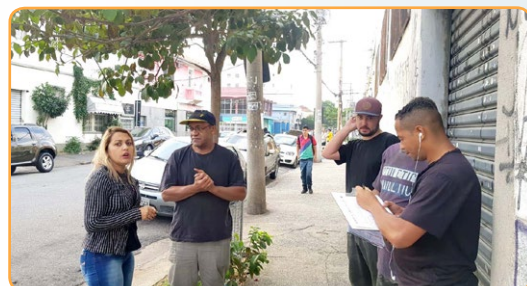
ST JAMES Alsira e assistente