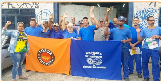
C.PRINT Yara e assistente