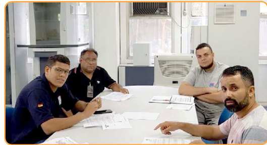
RITTAL Érlon, assistentes e comissão de trabalhadores