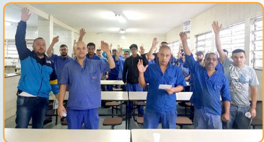
ARIETE Assistente do Donizeti