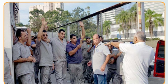
MAGMA SOLDA Assistentes do Carlão