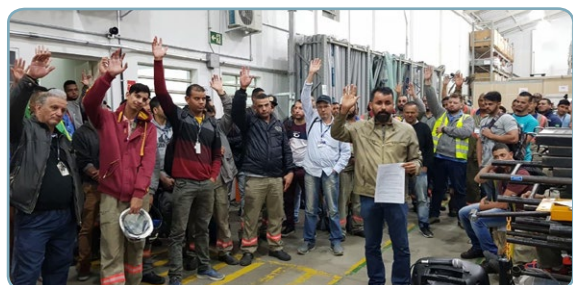
ALSTOM Érlon e assistentes