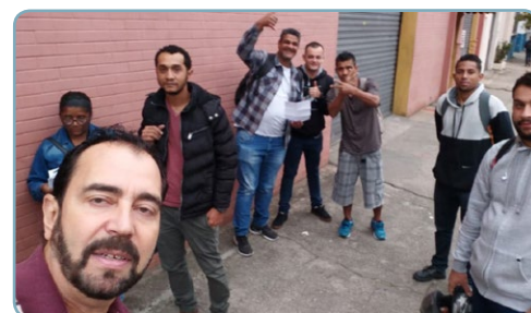
PERSIANAS ACCIARD Ninja