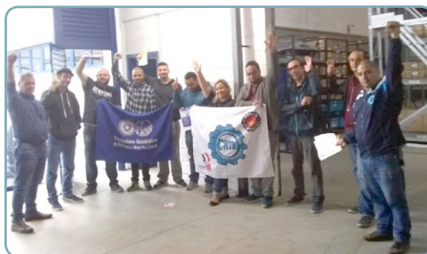
BREKLER Assistentes do Teco