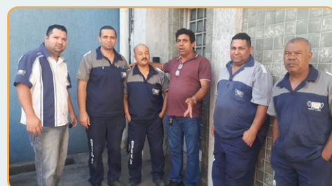
ACÚSTICA SÃO LUIZ