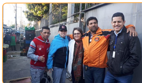
PINGUIM RADIADORES Assistentes do Chico Pança