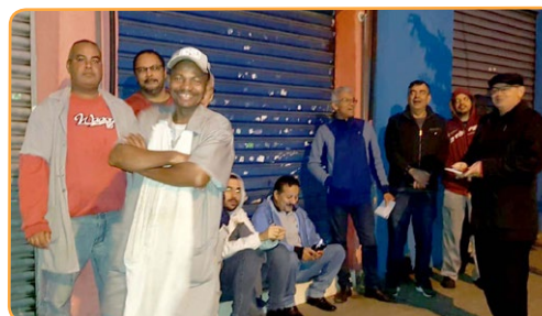
CARDAL Ceará e assistente