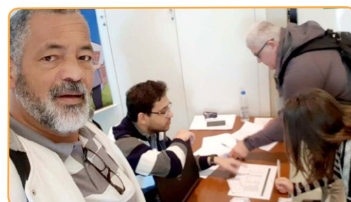
PEUGEOT Assistente do Arakém, secretário-geral