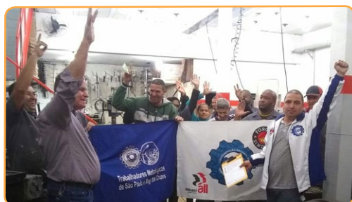
ANTELECOM Assistentes do Teco