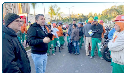
MRV Luisinho, em apoio ao Sindicato dos Trabalhadores da Construção Civil (SP)