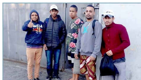
PINGUIM RADIADORES Assistentes do Chico Pança