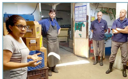
CROMAÇÃO UNIVERSO Sonete e assistente