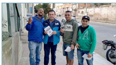
LKW, METALFIRE e GOODWAY