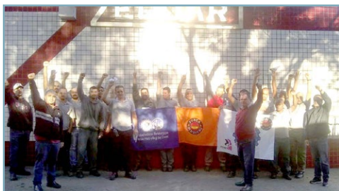
ZELOART Assistentes do Teco