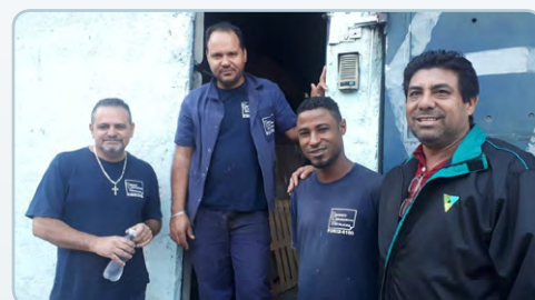
DONOSTI Assistentes do Chico Pança