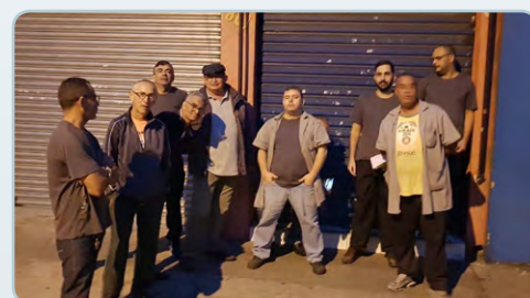
CARDAL Ceará e assistente