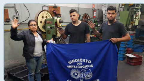
TECNIFER Sonete e assistente