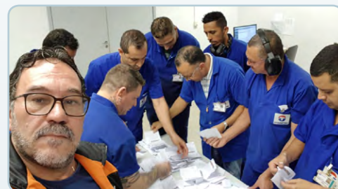
STAMPTEC Assistente do Jesus