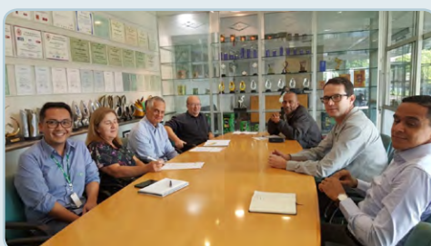
BRASILATA Maloca e assistente