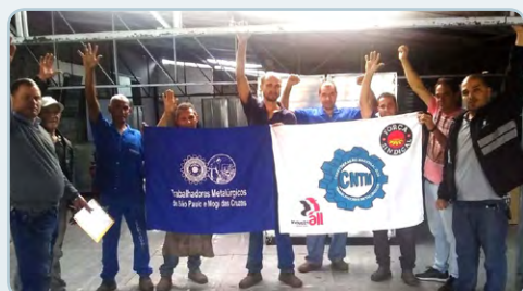
INOPAN Assistentes do Teco