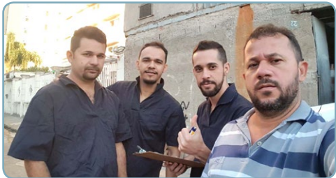
ARTEGA Assistente do Maloca