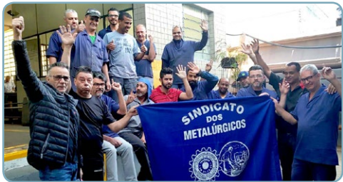
NEUBERG Mixirica e assistente