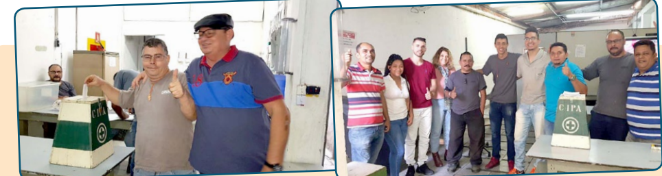
CARDAL – Assistente do Ceará