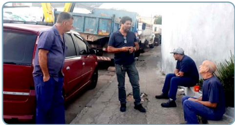
RETENTORES INHASZ Assistentes do Chico Pança