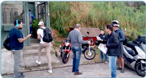
FIASCHI Assistentes do Teco