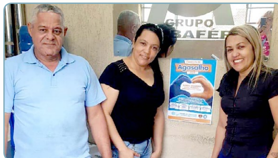
ALBAFER e GP CABOS Alsira e assistente