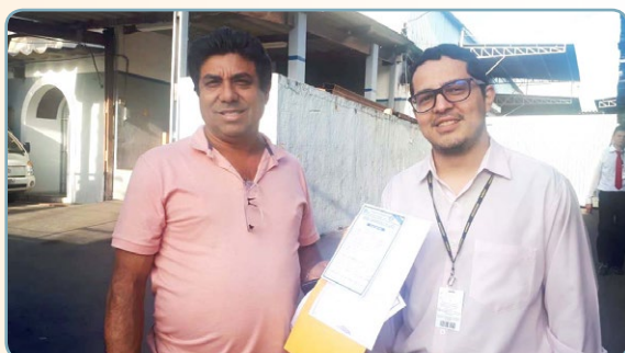
PINGUIM RADIADORES Assistentes do Chico Pança