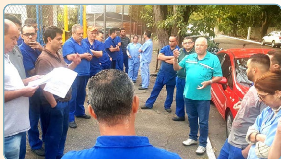
DECTECH Assistentes do Carlão