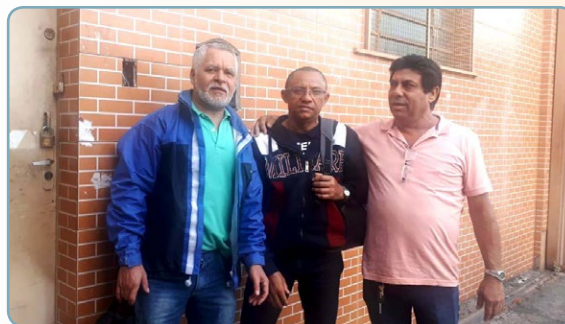
METALCORTE Assistentes do Chico Pança