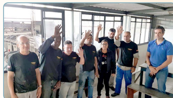
GOLDWING Sonete e assistente