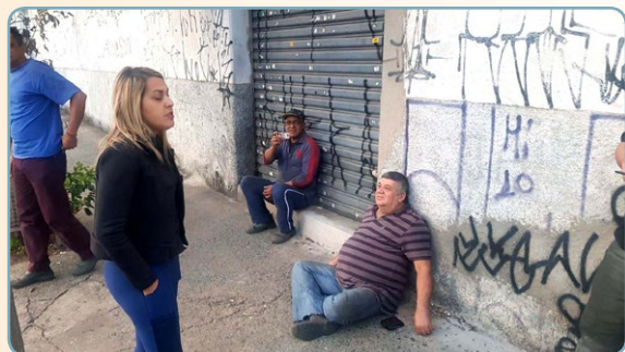
ST JAMES Alsira e assistente