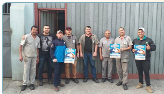
WG Biro e assistente