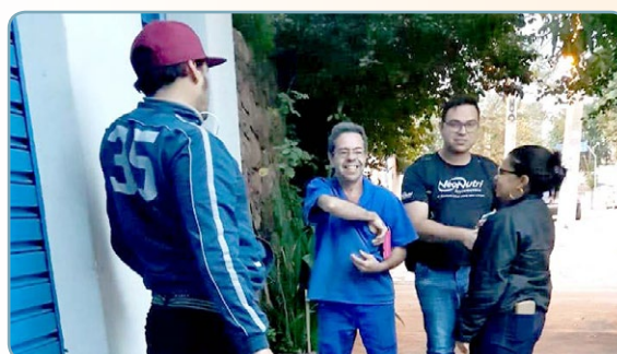
POINOX Sonete e assistente