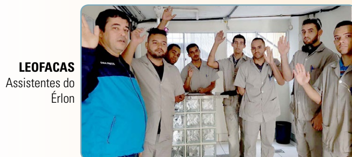
LEOFACAS Assistentes do Érlon