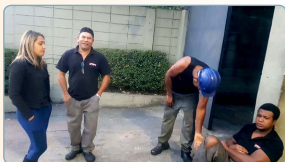
TRANAL Alsira e assistente