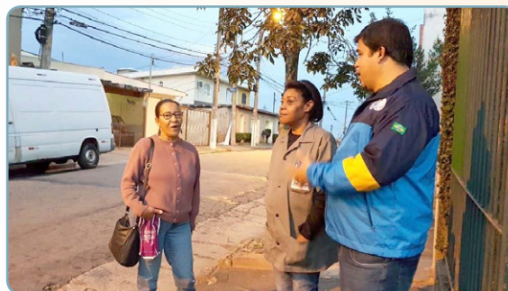
MAUSER Assistentes do Érlon