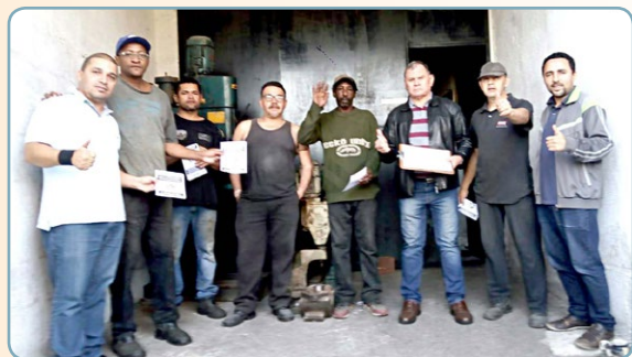
MARCOFLAN Assistentes do Teco