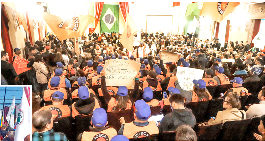
Ato pela Soberania do Brasil, 25/07/2025, na Faculdade de Direito da USP