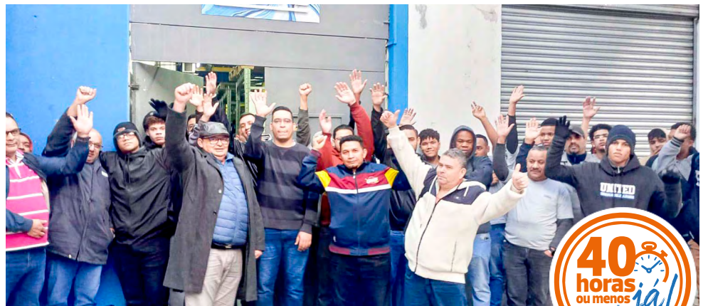
Conquista da redução da jornada na Cardal – Diretor Ceará

O nosso Sindicato continua com mobilização nas fábricas e negociações com os patrões para conquistar a redução da jornada de trabalho, sem redução salarial, para toda a categoria metalúrgica de São Paulo e Mogi das Cruzes.