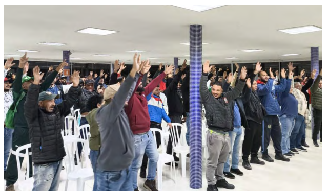
União e organização rumo à vitória!

E stá aprovada a pauta de reivindicações dos metalúrgicos de São Paulo, Mogi das Cruzes e região. A aprovação ocorreu em 26 de setembro, pelos companheiros e companheiras presentes à sede do nosso Sindicato, em São Paulo, e à subsele de Mogi das Cruzes.