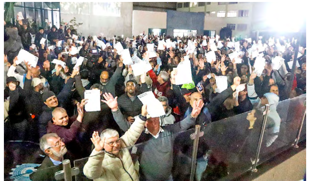
Expressiva participação da categoria metalúrgica