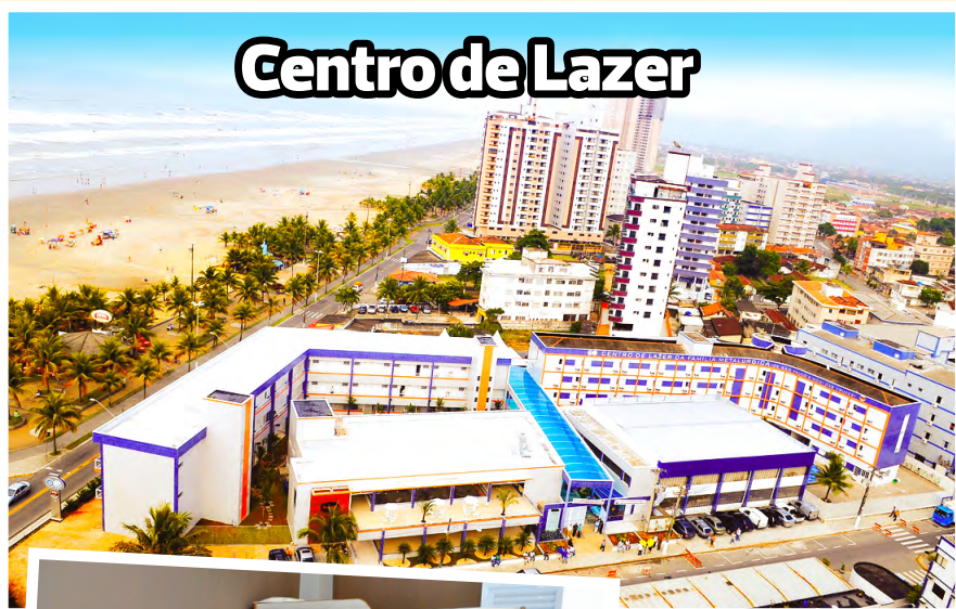
Centro de Lazer