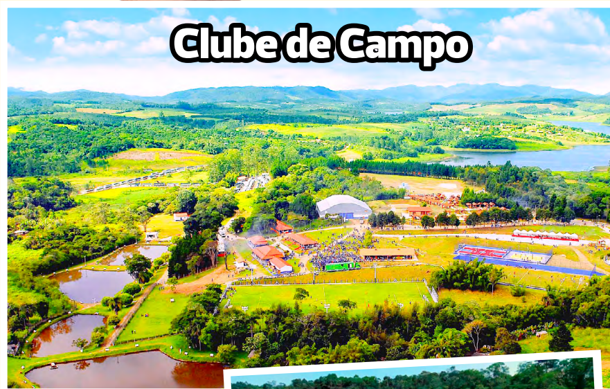
Clube de Campo