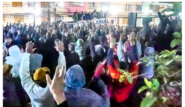
Trabalhadores(as) aprovam as lutas do Sindicato