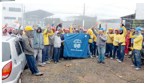
Trabalhadores aprovam suspender a greve