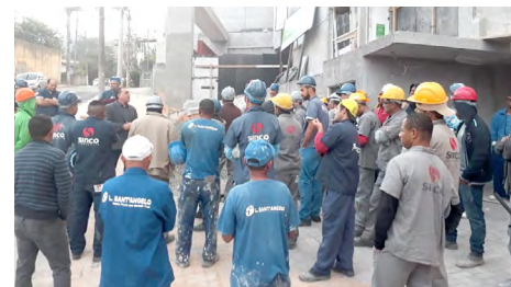
Mobilização na zona oeste

de Trabalho, único instrumento de defesa dos direitos trabalhistas, econômicos e sociais diante da reforma trabalhista, e ampliar a resistência à nova lei até mudar a lei”, afirma.