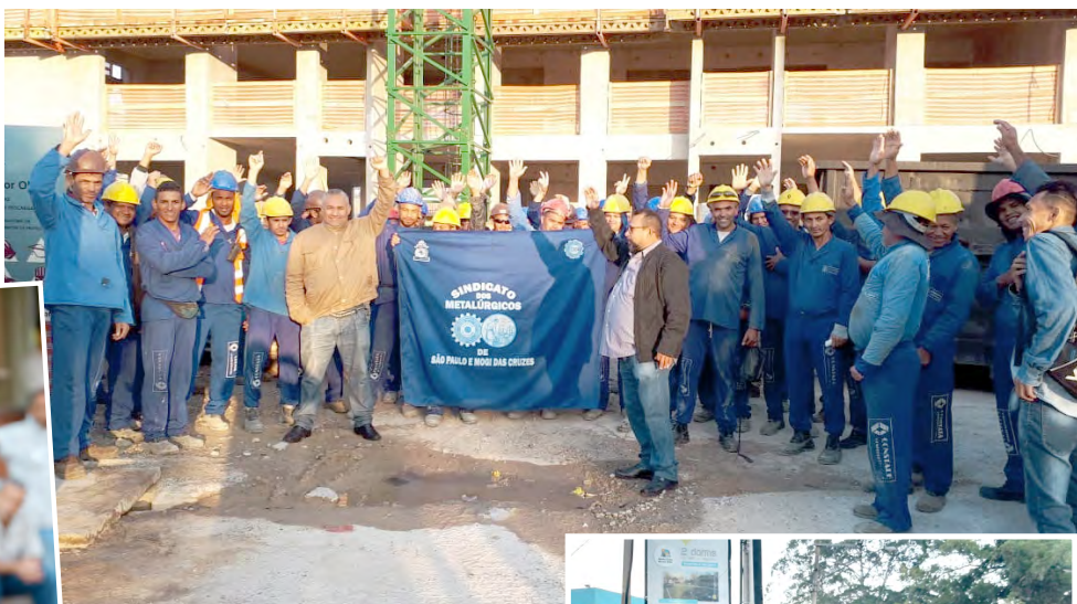
Operários em canteiro da Gafisa

“Vamos fortalecer essa unidade com todas as categorias pela garantia das Convenções Coletivas