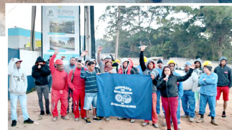
Canteiro de obra da Cury