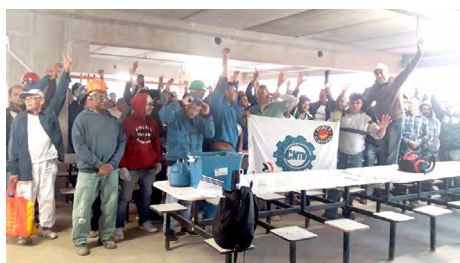
Refeitório de canteiro na zona leste