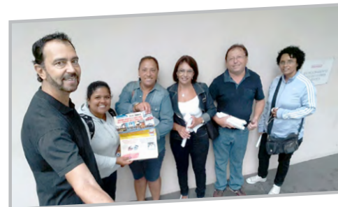
Diretor Ninja e equipe com trabalhadores da PEXTRON (zona leste)