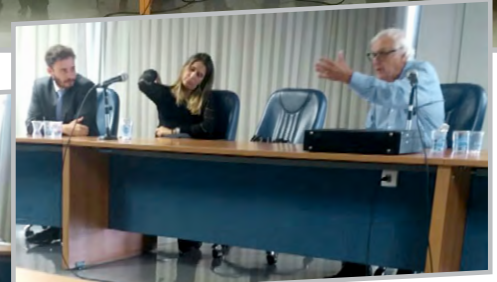
Ao lado, a bancada do Sindicato, acima, a bancada patronal