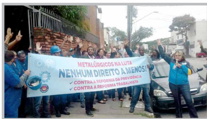
Equipe do diretor Alemão no trabalho de convocação dos trabalhadores da GP ISOLAMENTOS (zona oeste)