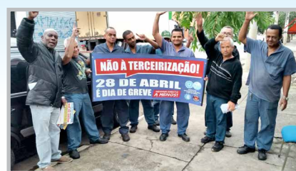
Equipe do diretor Ceará mobilizando os trabalhadores da SINDAL (zona oeste)