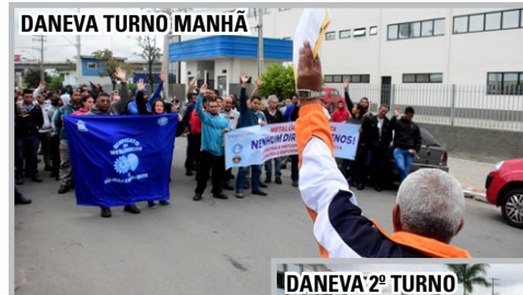
DANEVA TURNO MANHÃ