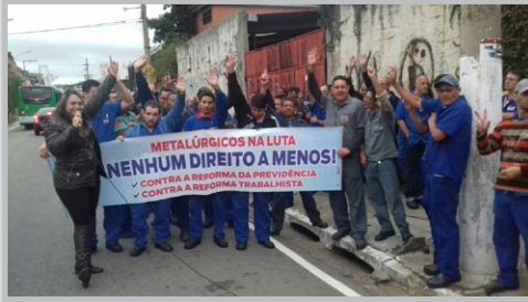
COMBUSTOL (zona oeste) Assembleia com a equipe do diretor Alemão