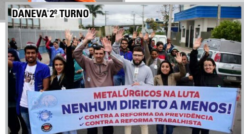
DANEVA 2º TURNO