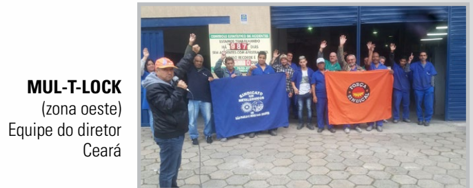
MUL-T-LOCK (zona oeste) Equipe do diretor Ceará