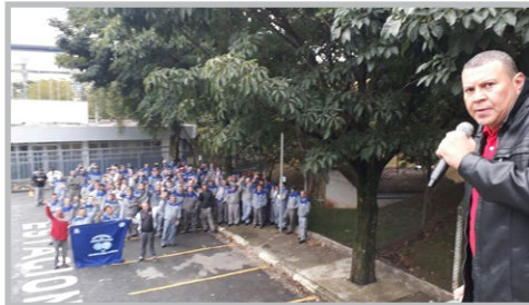
VOITH (zona oeste) Diretor Sales e equipe