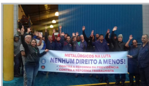
MMD (zona oeste) com a equipe do diretor Alemão