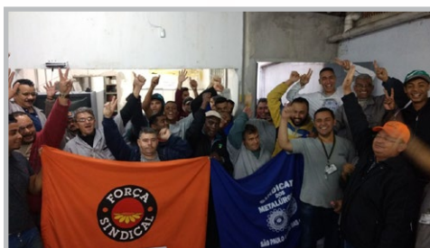
CARDAL (zona oeste) com diretor Ceará e equipe