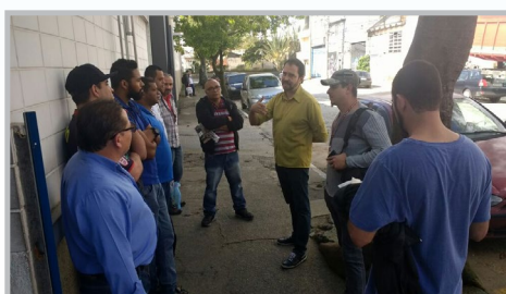
LORENZETTI IPIRANGA (zona sul) - Diretor Ninja e equipe fala dos encaminhamentos das lutas do Sindicato