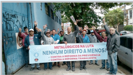
Diretor Mixirica e equipe mobilizando os trabalhadores da ALUMÍNIO BRILHANTE (zona leste)