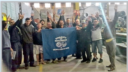
Diretor Bombeirinho e equipe na AÇODEX (zona leste)