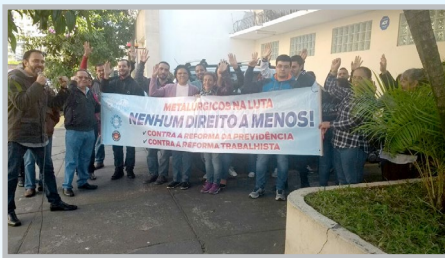
Diretor Ninja e equipe falando da importância da paralisação dia 30 na PEXTRON (zona sul)