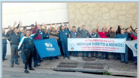
Equipe do diretor Alemão na LOMBARD (zona oeste) mobilizando contra as reformas