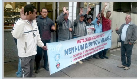
Coordenador Mazuti e equipe na NIQUELAÇÃO e CROMEÇÃO SCHNEIDER (zona sul)