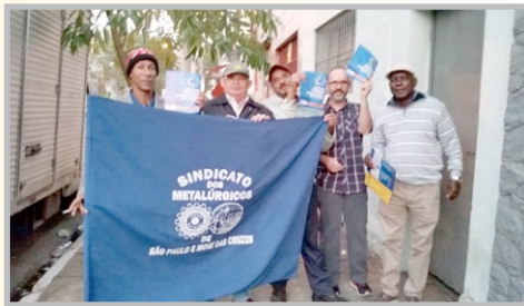
SINDAL (zona oeste) Diretor Ceará e equipe na empresa