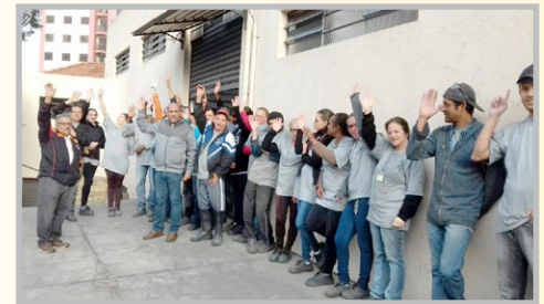
VENTIL MANETTI (zona norte) Diretor Maloca e equipe e assembleia de mobilização na empresa