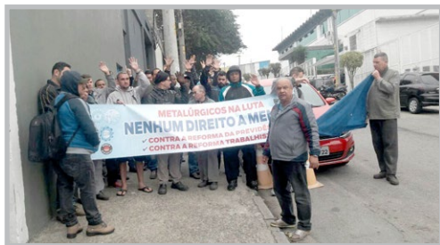
MASTERNOX e MULTI COZINHA – GREVE (zona leste) Trabalhadores paralisaram as atividades em protesto contra a falta

tirar direitos, sinalizando que o Sindicato é totalmente contra as reformas, divulgando o Centro de Referência e Atenção à Saúde da Família Metalúrgica e falando da importância de os trabalhadores se associarem ao Sindicato para fortalecer e intensificar a luta pelos direitos.