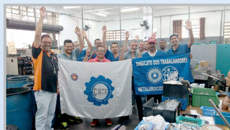
BIKOS (zona leste) Assembleia informativa sobre as reformas e de mobilização com diretor Jesus e equipe