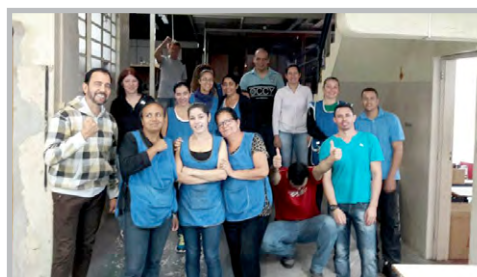
Convocação na SEIJI (zona leste) com diretor Ninja e equipe