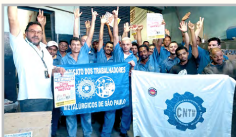
Equipe do diretor Jesus convocando os trabalhadores da GL (zona leste) para a assembleia desta 6ª Feira