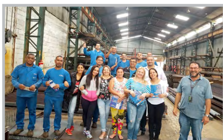
ACOSIL (zona leste) Em assembleia com equipe do diretor Jesus, trabalhadores discutem reforma, mobilização pra campanha salarial e aprovam reajuste de 20% no tíquete-refeição, a partir de dezembro.