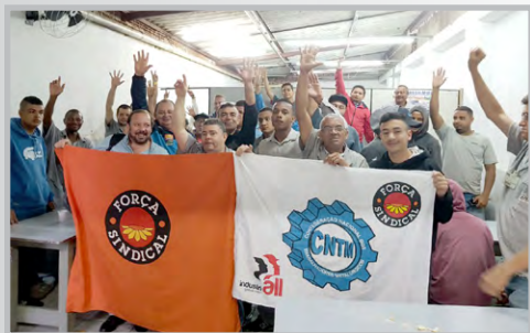
CARDAL (zona oeste) - Diretor Ceará realiza assembleia de convocação para o dia 10