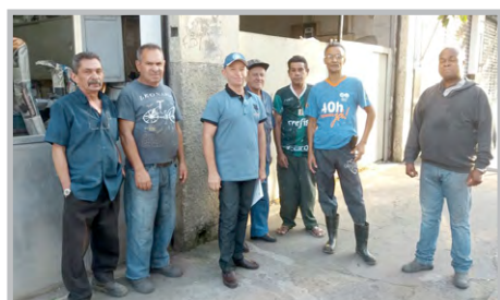
Diretor Biro na SCHNEIDER (zona sul)