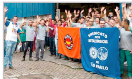
Assembleia na ILUMATIC (zona oeste) com equipe do diretor Sales