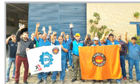
MUL-T-LOOK (zona oeste) - Convocação com diretor Ceará e equipe