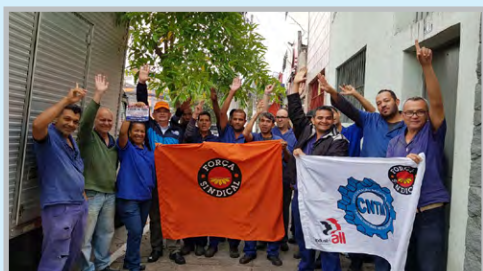
SINDAL (zona oeste) – Convocação com diretor Ceará e equipe