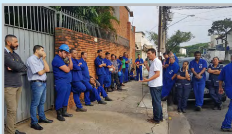
Assembleia na GP ISOLAMENTOS (zona oeste) com diretor Alemão e equipe