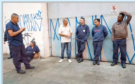
ARATELL (zona leste) - Diretor Bombeirinho e equipe discutem e alertam para os efeitos da reforma da Previdência com os trabalhadores