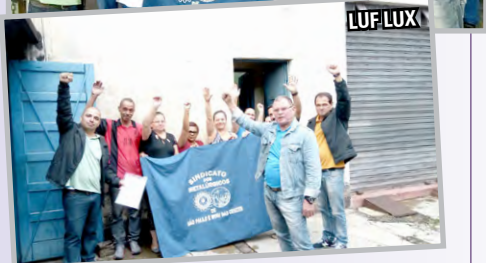
IMPÉRIO e LUF LUX (zona sul) – Assembleias com a equipe do diretor Teco discutem e aprovam o custeio sindical e sindicalização