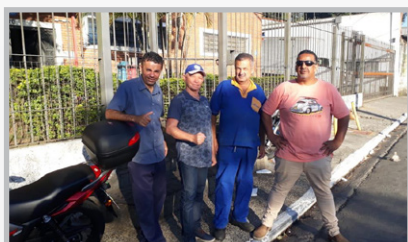
SBU – diretor Biro e equipe