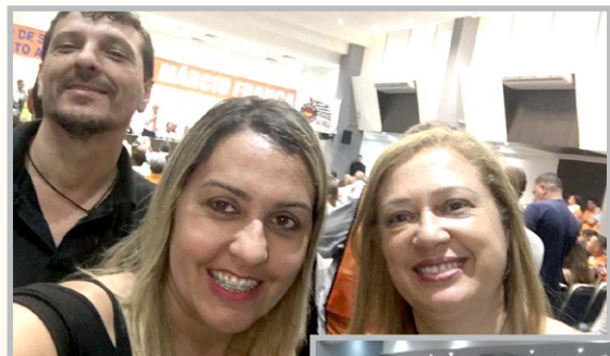
ELEIÇÕES 2018 – diretores Ninja, Alemão e Alsira participam de encontro de sindicalistas com Márcio França, candidato ao governo de SP.