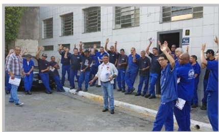
ASTM – diretor Mala e equipe.