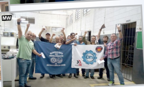
Equipe do diretor Teco convocando os trabalhadores da FBP, KETESE, MILLING e MW (zona sul) para a assembleia regional de mobilização contra as reformas nesta quinta-feira (27)