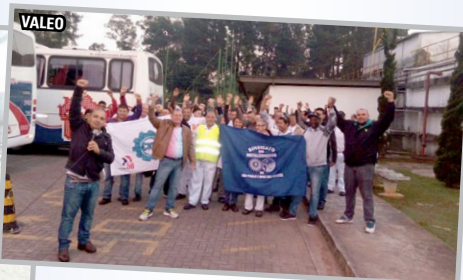
Equipe do diretor Teco com trabalhadores da PTI e da VALEO (zona sul) . As assembleias tiveram a participação da equipe do diretor Sales