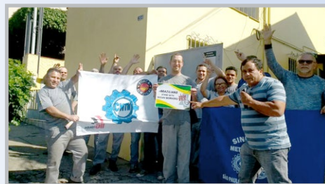
Em assembleia com a equipe do secretário-geral Arakém, trabalhadores da PRISCELL (zona oeste) manifestaram apoio aos trabalhadores da Nissan, repúdio às práticas antissindiais da empresa e foram convocados para a assembleia regional contra as reformas no dia 3 de agosto