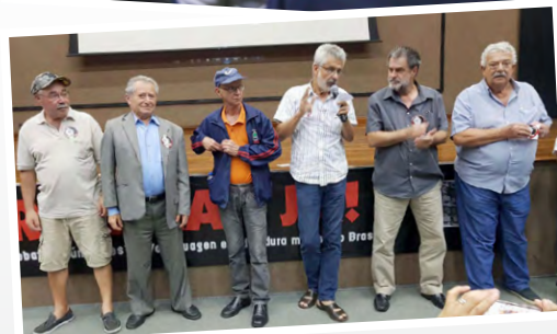
Grupo de ex-trabalhadores da Volks

de fazer isso é levar informação pra categoria, promover eventos como este. Este período terrível da história do Brasil, a repressão, a perseguição ao movimento sindical e aos trabalhadores precisam ser debatidos, esclarecidos para que não ocorram