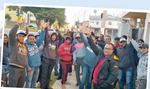
Paralisação em obra no Jardim Belém