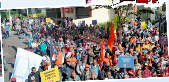
Protesto dos operários em frente ao Sinduscon