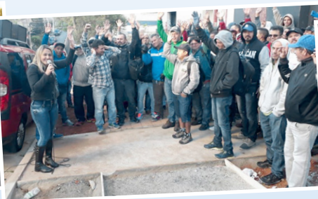
Mobilização em obra da Cyrella