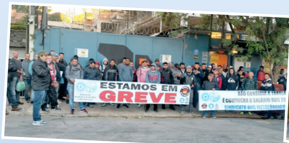
Assessores à frente da greve