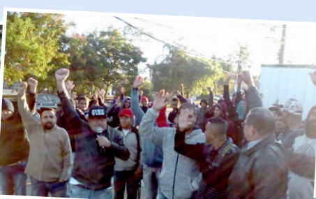
Greve em obra da Racional