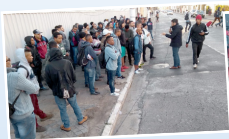
Assembleia em obra da Incorbase