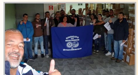
JBT Equipe Yara