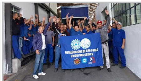
JANGADA Bombeirinho e equipe