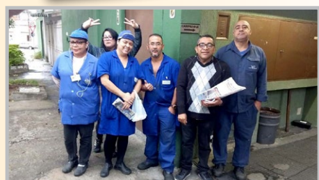
AROUCA Equipe Nelson

NA LUTA CONTRA AS “REFORMAS” TRABALHISTA E DA PREVIDÊNCIA