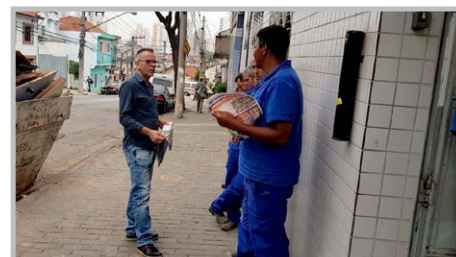
VENTISILVA Mixirica e equipe