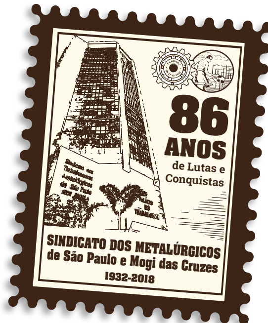
Este é o selo comemorativo dos 86 anos do Sindicato