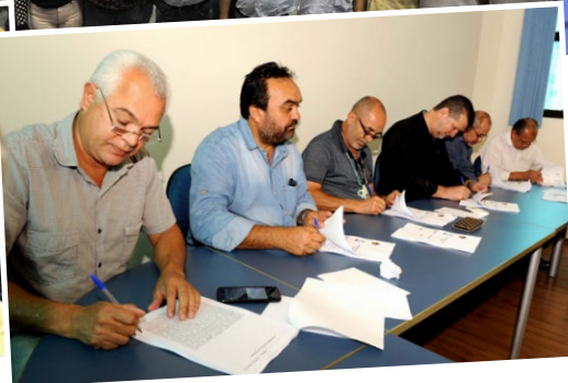
Assinatura de acordo na Federação