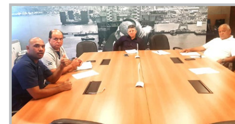
BOILER DO BRASIL