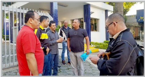
ALSTOM SEGULA JMS Érlon e equipe