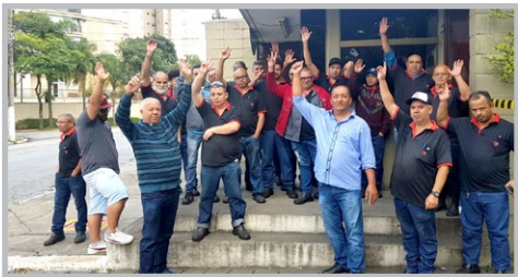
STI Equipe Carlão