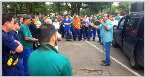
GREIF Equipe Carlão

Nas recentes mobilizações dos diretores e diretoras do Sindicato, e suas equipes, por PLR, melhorias nas condições de trabalho, avanços nos benefícios e sindicalização, a categoria também é informada sobre o andamento da campanha salarial, o reajuste conquistado (com aumento real, abono e manutenção das conquistas das Convenções Coletivas) e os grupos patronais que já fecharam acordos. Onde não houver acordo, é greve neles!