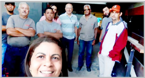
ALFA METAL Sonete