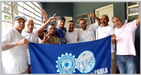
PROFINOX Bombeirinho e equipe