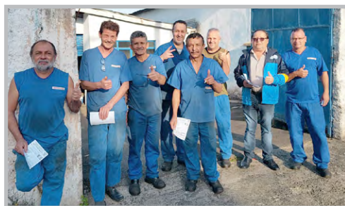
Equipe do diretor Ninja na PRISCAR