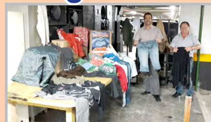
Diretor Ninja e equipe com doações feitas por trabalhadores de empresas do setor (zona leste)