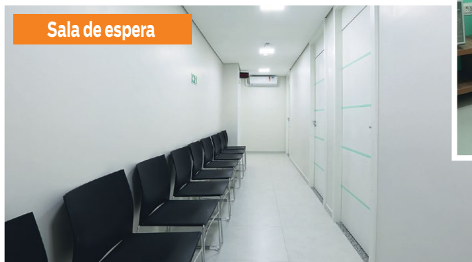
Sala de espera