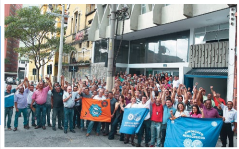
Diretores, assessores e trabalhadores em frente ao Centro de Atenção à Saúde