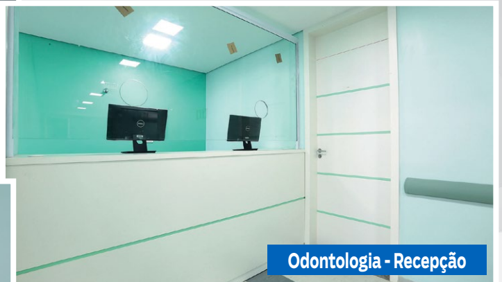
Odontologia - Recepção