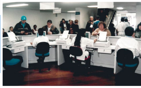
Atendimento à categoria nos anos 1990