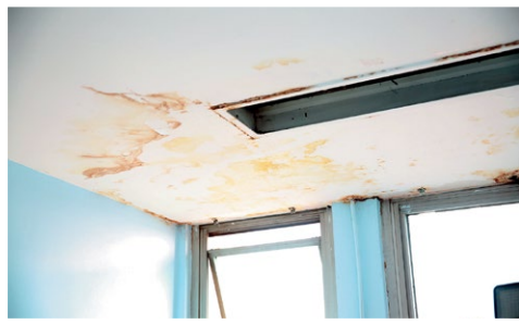
Situação anterior às reformas - Salas em desuso