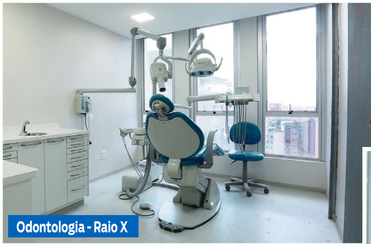
Odontologia - Raio X