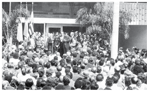
Inauguração do Ambulatório em 1974