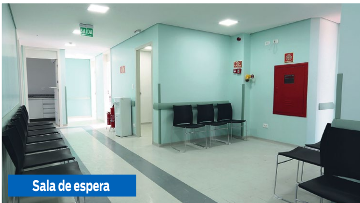
Sala de espera