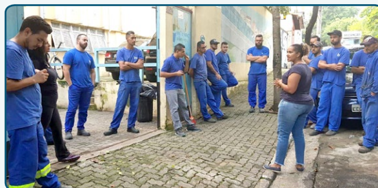
ISAR Yara e equipe