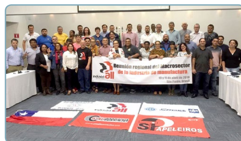
REUNIÃO REGIONAL DA INDUSTRIALL