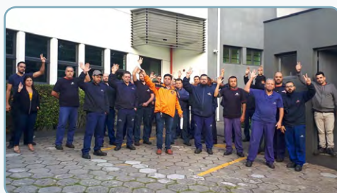
ARTEPEÇAS Assistentes do Chico Pança