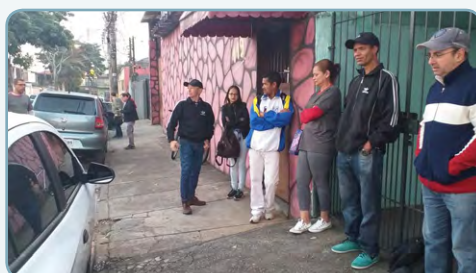
EDIPAR Biro e assistente