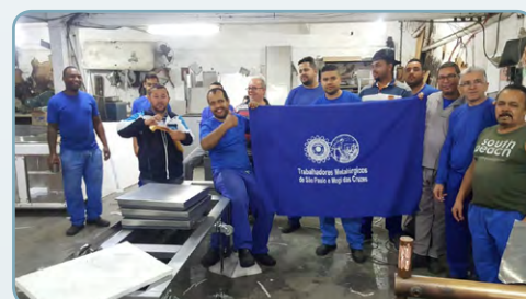
FRITOMAQ Assistente do Maloca