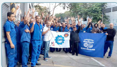
FANANDRI Bombeirinho e assistente