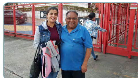
AMPLICABOS Assistentes do Érlon