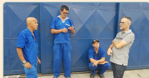
LUCARBOM Diretor Mixirica