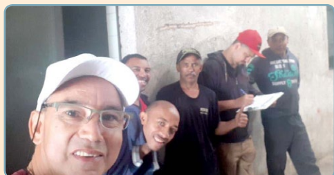
HEAVY STEEL Diretor Bombeirinho