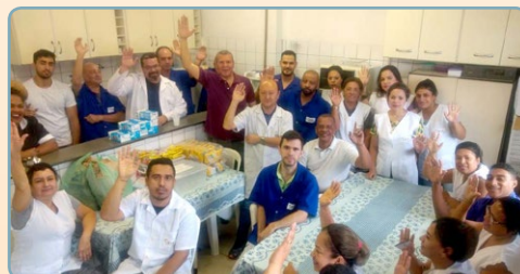
LOKTAL MEDICAL ELETRÔNICS Diretor Sales