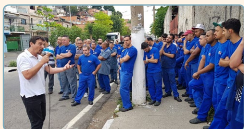
COMBUSTOL METALPÓ Diretor Alemão