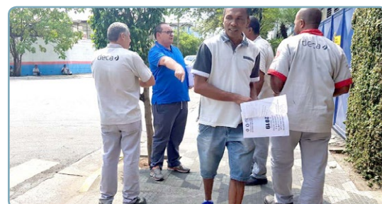
DECA Diretor Ceará