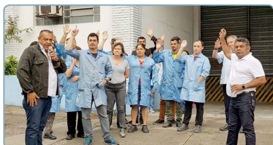
ELETROFORMA Diretor Mala e assistente