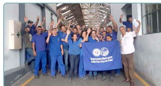
JANGADA Diretor Bombeirinho