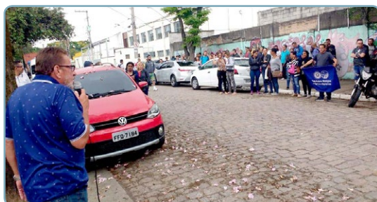
LUMINI Diretor Teco e assistente