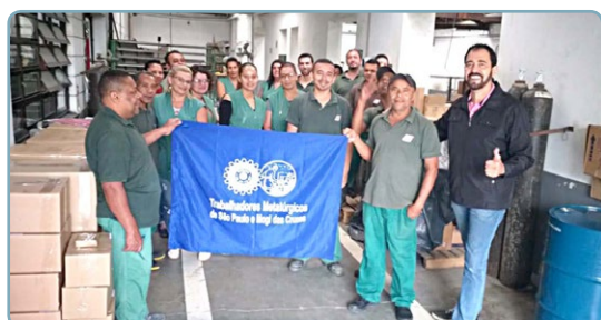
SPORT BRINDES Diretor Ninja