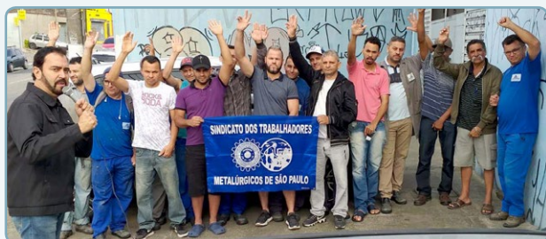
ALUTINGA Diretor Ninja