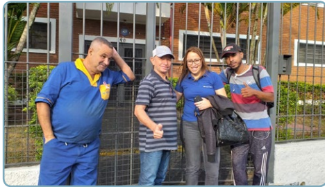
SBU Diretor Biro