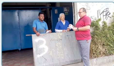
AFIGRAF Diretor Ceará