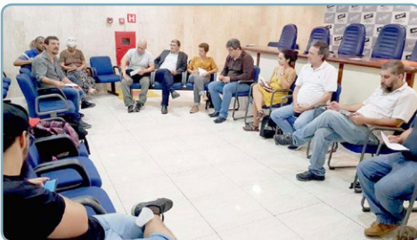
FRENTE DE LUTAS PELA SOBERANIA NACIONAL Diretor Alemão – em reunião, dia 16, na Apeoesp