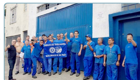
ROAPLAS Diretor Mixirica