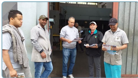
WG Diretor Biro