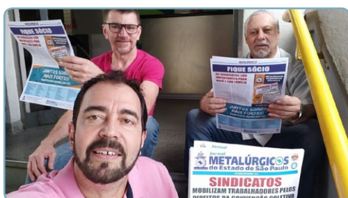
LORENZETTI Diretor Ninja