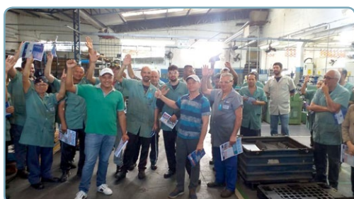
USIBANI Diretor Biro e assistente