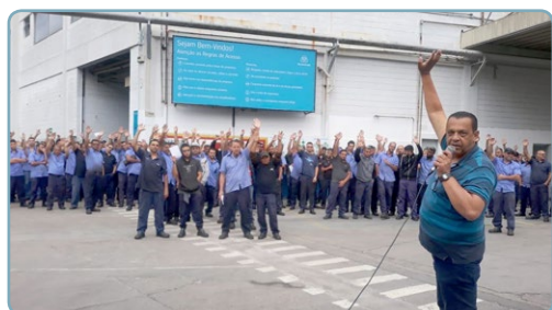
THYSSENKRUPP Diretor Mala