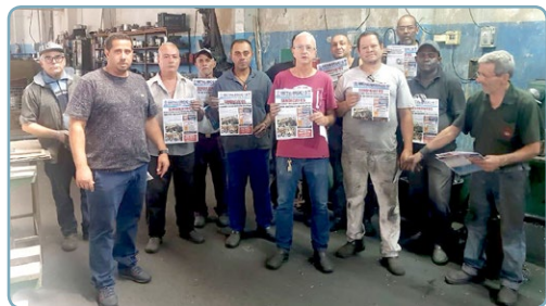
ALUMÍNIO AURIO BRANCO