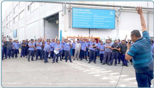
THYSSENKRUPP Diretor Mala