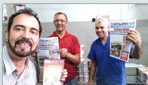
DALMET Diretor Ninja