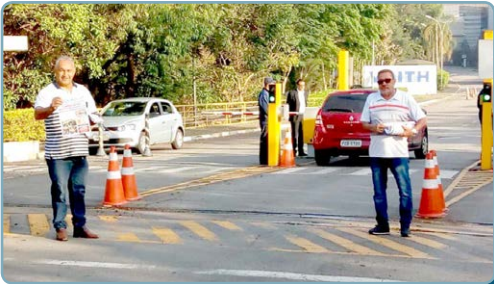
VOITH - Diretor Teco e assistentes