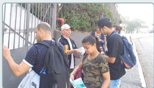
CPL Diretor Biro