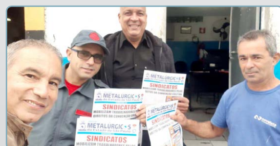
EWA Diretor Bombeirinho