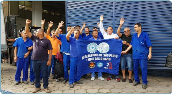
MUL-T-LOCK Diretor Ceará