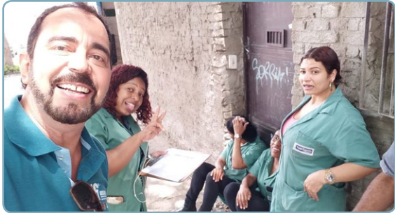
SWITERM Diretor Ninja