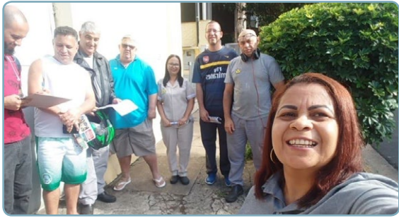
PRINCEL Diretora Sonete