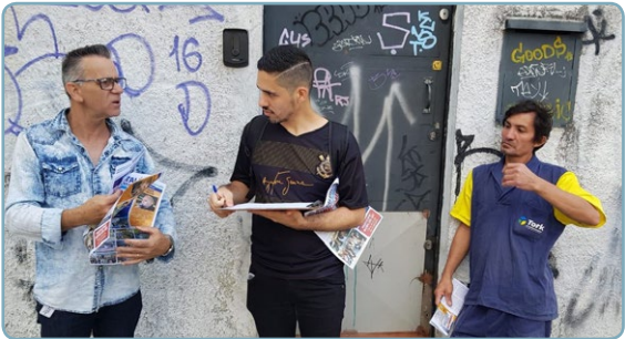
TORK Diretor Mixirica