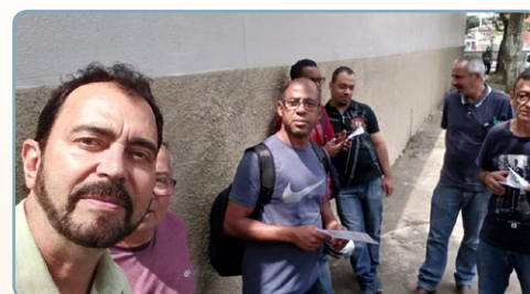
LORENZETTI Diretor Ninja