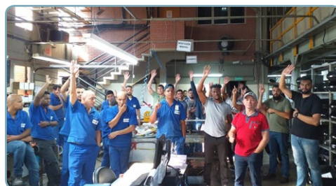
CONSISTEC Diretor Biro