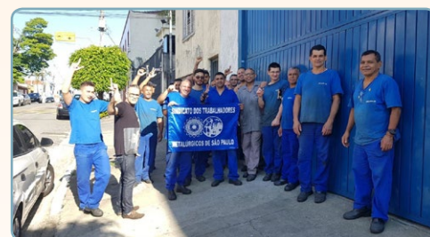
ROAPLAS Diretor Mixirica