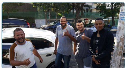
AUREON Assistente do diretor Maloca