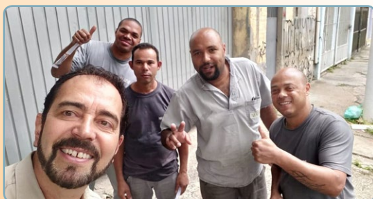
NEADE Diretor Ninja