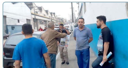
NOVALATA Diretor Bombeirinho