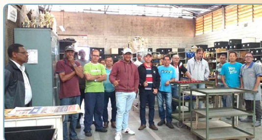
PIAZZA Diretor Biro e assistente